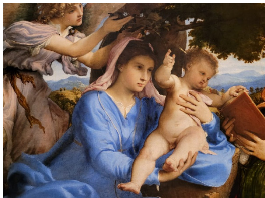
Maria mit dem Kinde, Lorenzo Lotto (KHM Wien) - Polster